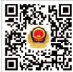
首都网警 微博二维码