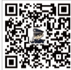
首都网警 微信二维码