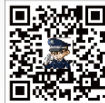
首都网警 今日头条二维码