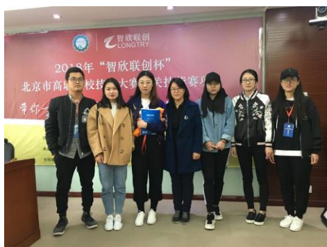
2018年报关大赛获北京市级三等奖