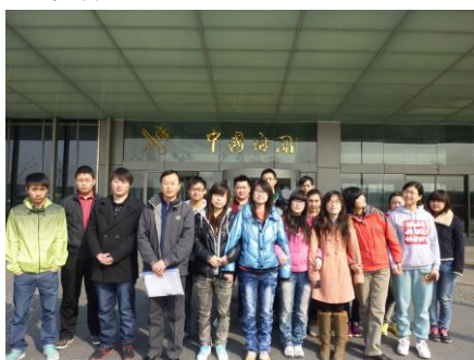
观摩海关业务流程