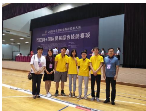
2017年、2018年连续获全国职业院校技能大赛“互联网+国际贸易”赛项国家级三等奖