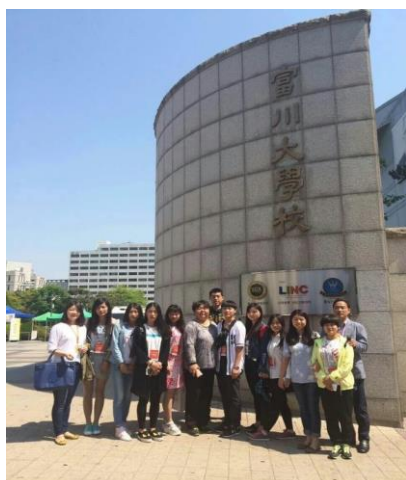
韩国富川大学游学