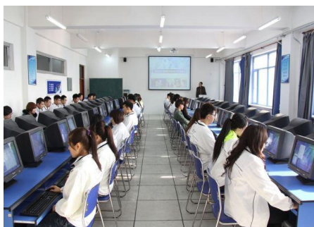
外贸业务软件实训