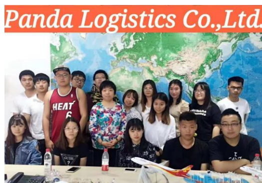
万达杰诚国际物流（北京）公司沙龙活动